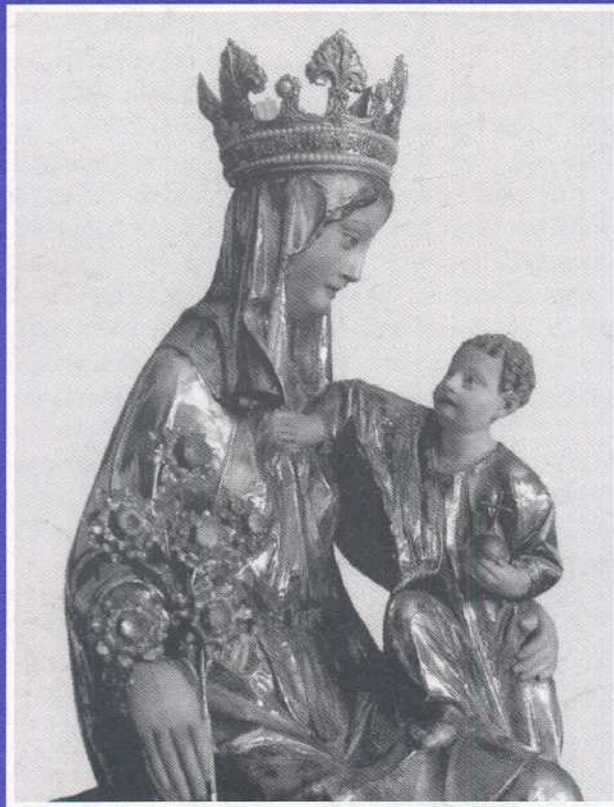
ORREAGA'KO ANDRA MARI

BIZKAIKO FORU ALDUNDIA KULTURA SAILA LAGUNTZAILLE