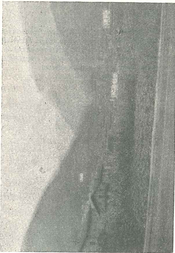
Areatza (Villaro) Añibarro'ren jaoterría