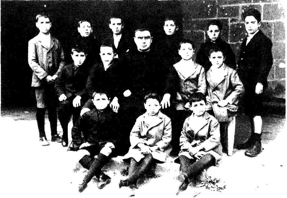
ONDARROA'ko antxiñako abeslari txikiak