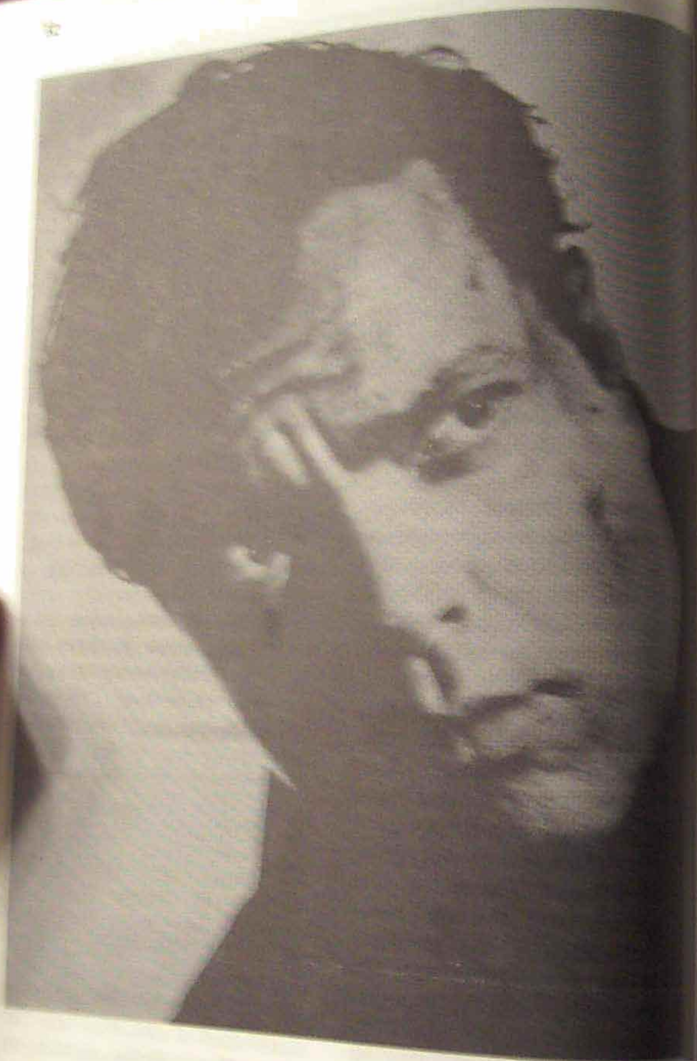
"Errepublikaren gizona" (1949)