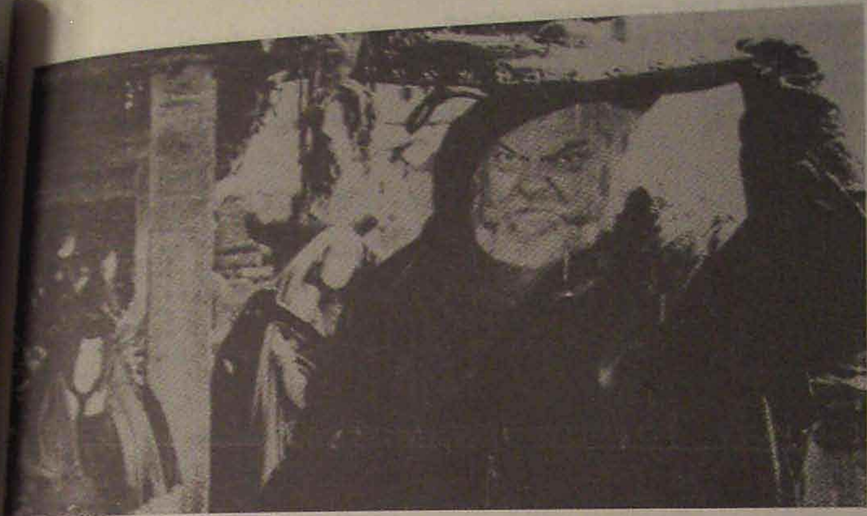
Shakespeare'ren "Falstaff" (1966)

Egingai bakotxari ondo ego- tion irrizko pikorra jarten eutson. Otelon eta Falstaff'en, esaterako, beti zindo, prestu ta bete dabil. Begiak naro, soñia astun, eskak zabal, mikrora urreratzean dar- darka, alaitasunik bagako arpegi- kerá... "Kane" papera egitera- koan, osterá, egiana egiala, iñoa- na iñoala, berak edegi bear zituan uriko atea, berak itxi, ango ezku- tu, biur-une ta errapideak eraku- tsi... Zer da mundu onetan egia ta zer da guzurra? Zuzenbidea, alan be, dirauana dozu. Astiro doa, lau aizetara bialdu oi ditu edozeiñen lotsabakokeri ausartak, edozeiñen asarre-sumin, itz-gaizto ta eupá- dak, zorakeri ta lillurak, baita edozeiñen barne-min eta umoreak be. Orson'ek ba-daki au.