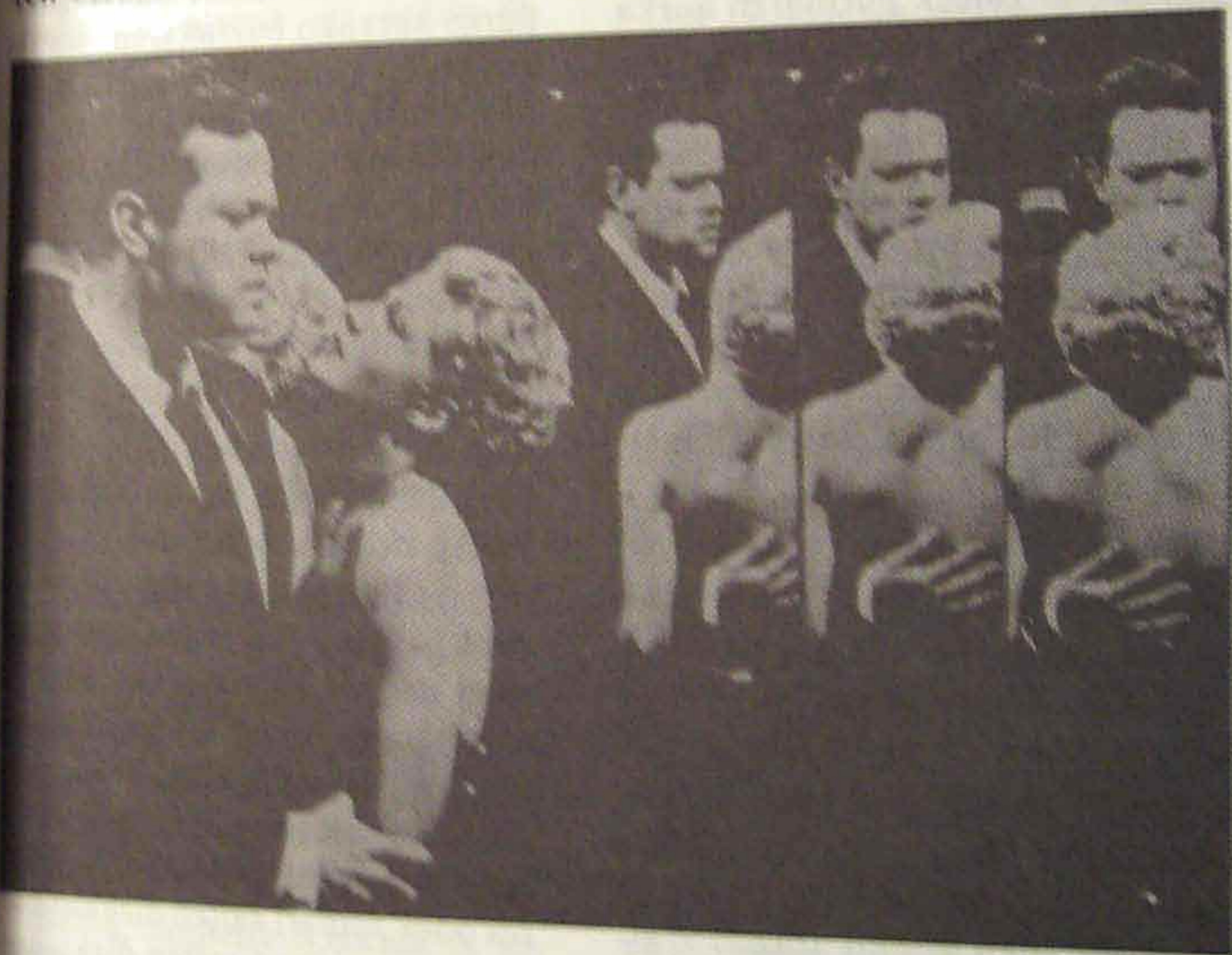
"Shanghai'ko Andrea" (1945)

Orrelaxe, gizuren legez, munda obetu naiz, tristeari poza eskuratu guraz, igaro zan ludi onetan barrena. Asmo ta xede lilluragarriz gainezka eukan oindiño arima bipilla; baiña arrats eguzkitsu batean, deia izan eban, mundu au itxi ta besterako deia. Erio lez Jainkoa be, beti gogotan erabilli erabilli ebanak, ziur asko, egiñiko lanen ordaiña eskuratua dau da-goneko.