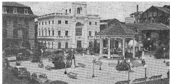
skatasunaren enparantz: A skatasuna Gai, Gaiña demokrazia?