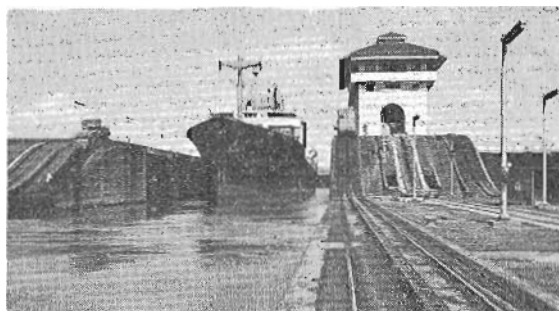
Urbidea, Panama'tarren samin-bidea. USA'tarrak or aberashidea.