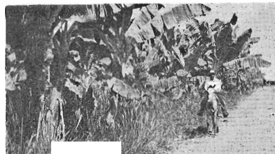
Beroa beli, euria neguan, lur aberatsa.

Eguna argitu eta laster Panama'ra eldu giñan. An neulcazar itxaroten euskaldun adiskideak, nire oporraldi onetan laguntzaille