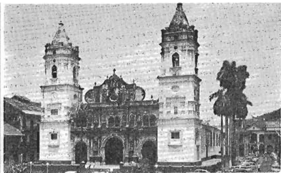
leizea, Panama'ren aurrerapenean lagun: orra or antxiñako katedrala.

Indiarrak dira-bertako lenengo ta jator diran biztanleak. Indiarrak, geroago ta geiago baztertuta dagoz eta euren «reserva» edo inork kendu eziniko lurrak eskatzen dabez. T'orrijos'ck urrengo arto-batzerako lurrak eta etxeak eurenak izango dirala esan dautsoe neure aurrean. Sinistu lei? Enda bat baiño geiago dira, eta euren izkuntza bereziak daukez. Alkar ulertzeko gaztelaraz berba egiten dabe. Orretan ba dauke gure antza. Oianctan, ibai-crtzetan eta muño-gaiñeetan bizi dira eta «piragua» dabe komunikabide bakarra. El Real, Palma ta Yabiza dira euren uri nagusiak. Bakoitxak 1.000 biztanle inguru. Komunikabide bakarra, egazkiña. Etxe guztiak zuczkoak, olezkoak, dira eta etxegañca lasloantzekoa. Biotz onekoak dira eta Zuluaga'tar Dionisio mixiolaria lagun nebala egin gcuntsoczan ikustaldi batzuk, Pinugana, Yape ta Union'era, eta oso ondo artu ginduezan. Euren etxe baten bazkaldu genduan, baiña baItzen auzoa zan. Antziña esklabu (jopu) izan eta basora iges egien ondorengoak.