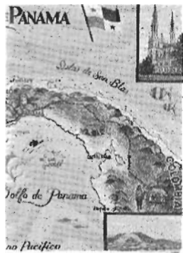
ere buruaren jabe.