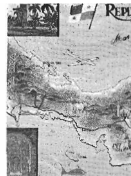
Panama, txikia b

Aurten ibillaldi luzea egiteko erea izan dot.