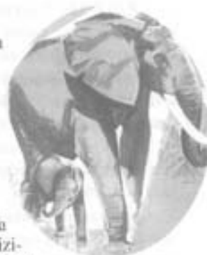
Elefantea marfillaren iturria.