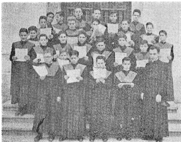
Artea'ko abadegai abeslariak.

duaren jaiotetxe dan ERREKAKOETXE'ra joan ziran guztiak.