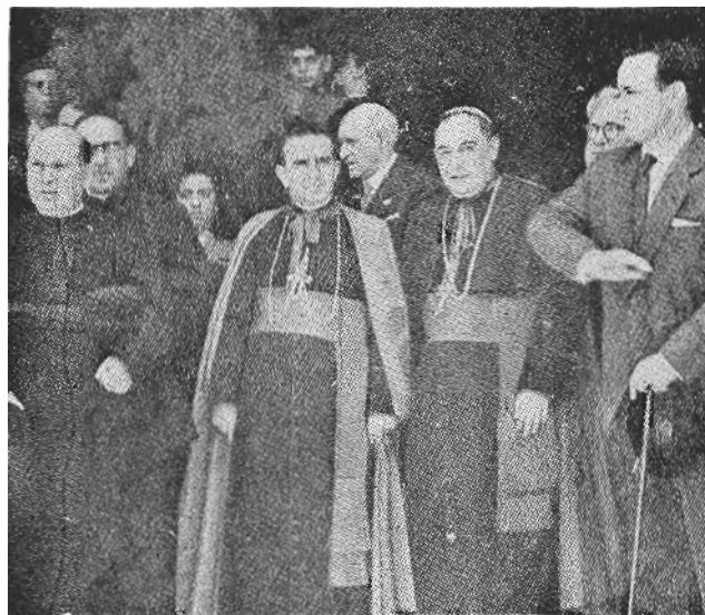
Bilbo'ko eta Gazteiz'ko gotzaiñak.