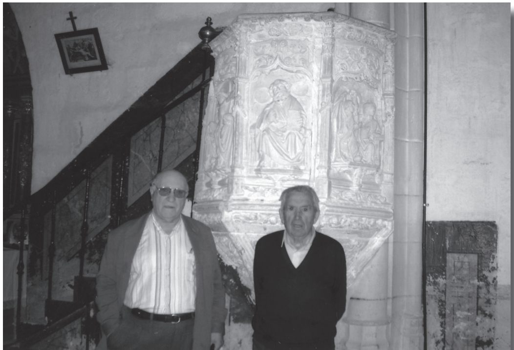
Añastro: Pulpitu arrigarria.

Eleiza`ren ate, ateartea eta berak emoten dauan itxura, ikusleentzat oso alper, nagi edo baldras agertzen da eta bere ateko albo bietan, gaztelera idatzita agertzen dira: “DE TODA PALABRA OCIOSA DARAN LOS HOMBRES CUENTA RIGUROSA”. Beste aldean “LA