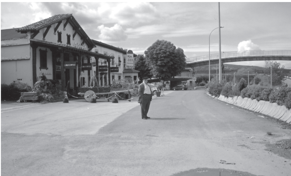
Palacios, km. 333.

Lurraz: Garia, garagarra, lur-sagarra, lekadun landareak eta txerri-arbi edo udarbi`ak (remolacha) artzen