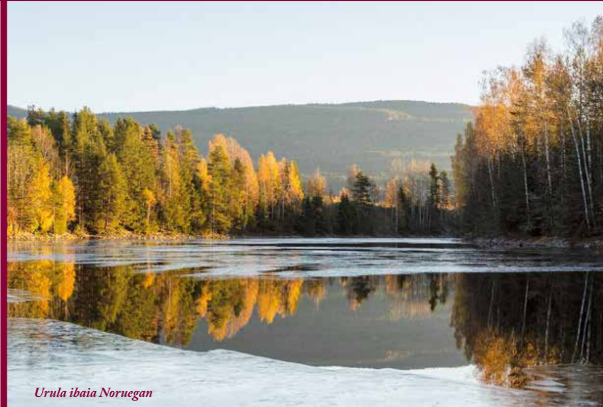
Urula ibaia Noruegan