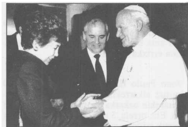
Aitasuntua Gorbachob'en Reixa emazteari errosario eder bat eta beste laguntzallei Vaticano'ko domiñ-aundiak ematen.

Luzaroan egon ziran alkarri eskuak emanda. "Gure arteko arremanetan auxe da unerik garrantzitsuena" zion Joan Paulo'k. Eta, Gorbachob'ek erantzun: "Atsegin zait oso alkarrengandik ain gertu egotea, ekintza bereziak alkarrekin aurrera eramán aal izateko bai URSS'ek eta bai Aulki Santuak."