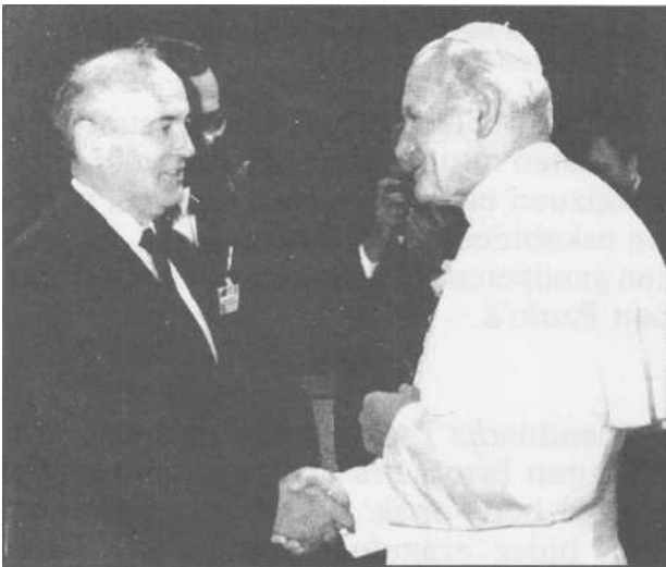
Gorbachob eta Aitasantua alkarrekin 1989'ko Abenduaren 1'ean Vaticano'ko egoitzan.

Joan Paulo II'arekin egon-berria da, 80 minutuz alkarrekin. Amaitzerakoan, Aitasantuarekin bakarka egon nai zuela adierazi zuan. Eta, orrela, 5 minutuz egon ziran biak bakarrik ixilleko autumutuetan.