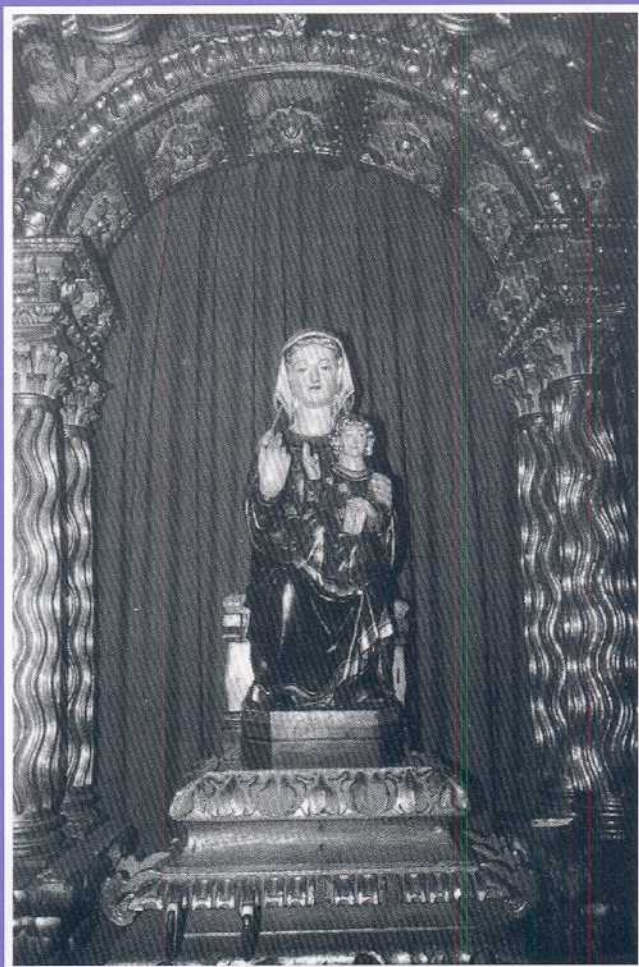
ALLENDE'KO AMA (EZKARAI-ERRIOXA)

BIZKAIKO FORU ALDUNDIA KULTURA SAILA LAGUNTZAILLE