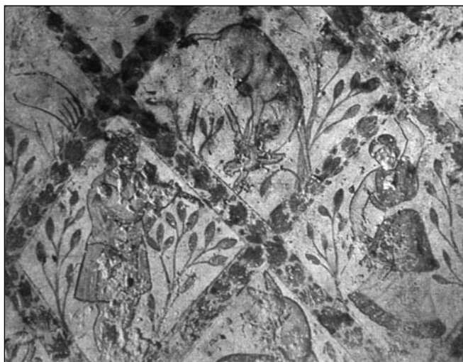
Islandarrak ormak margotzen zaleak dira (Jodanian 'n)

Arabiarrak, Maoma'k itxartu ebazenean, jakintza barria sortu eben, gaur arte indar aundia daukana, baiña margolaritzan egin ete eben lanik?