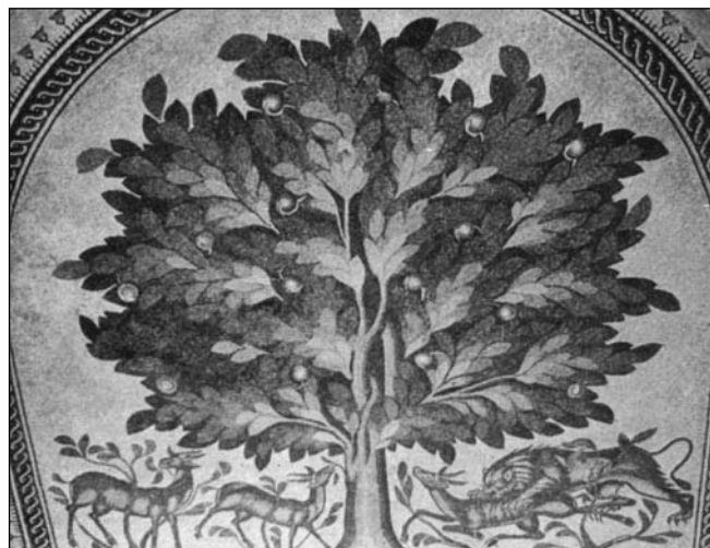
Mosaikoak be egiten dabez (Jodania'n 744 urtean)

Mamelukoak esaten jake Ejipto'n jarri ziranai eta emen be argi-mutillak apaintzen, leiar eta esmalteak margotuta, iñoz urrez apaintzen eta tarazea-lana egiten jarraitzen dabe.