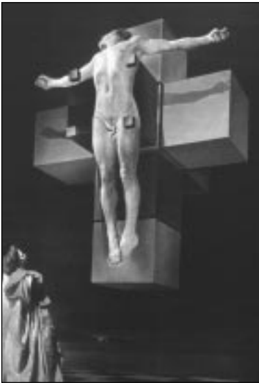
Kurutzea. Salvador Dali.

Irudidun edo figuratiboa izan da margolaritza orain artean, baiña ba-dirudi irudi guztiak eta era guztietara agertuak dirala eta orain irudi bageko margolaritza asmatzen dabe margolariak. Zer izango ete da irudi gabeko margolaritza au? Batzuk geometria sartuko dabe euren lanetara eta onei kubozaleak esango jake.