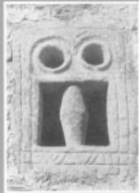
Mungia'ko Magdalena deunaren Bateleizan.