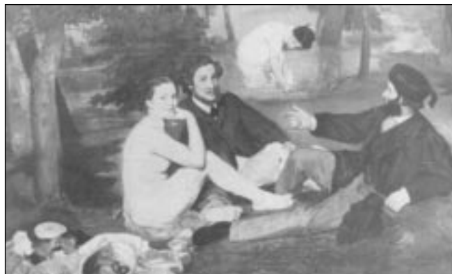
Monet. Bedartzan berausten.