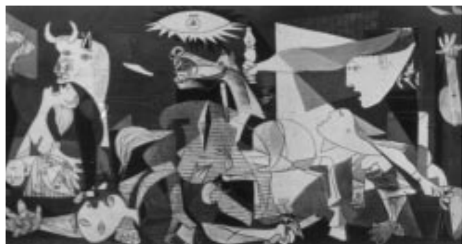
Picasso. Gernika Sutan.