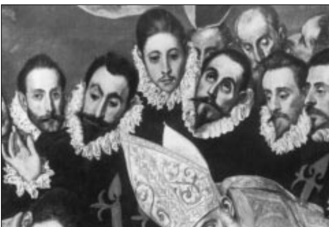
El Greko: Teledo'n: Ordaz kondearen illetea.