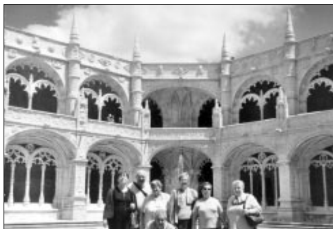
Lekaide Jeronimo`tarren etxea. Monastegia ta Basilika (Klaustroa).

Gosaria artuta bederatzi ta laurenetan Obidos`erantza urten gendun, eta an, XVI`n gizaldian iru kilometruan egindako ur-bidea ikusi-ta San Juan Bautista eta Santa