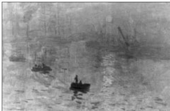
Monet. Eguzki-sartzea inpresiozaleen asierea.

XIX gizaldiaren azkenean agertzen da jokabide au. Onein ustez mundu onetan dana dago joanean eta margolariak une bat artzen dau, ori da beronen inpresioa. Eta jokabide orrek poztu ta bete egiten dau margolari inpresiozalea.