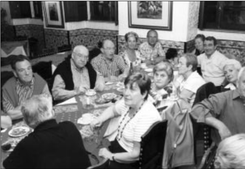
Bizkai'ko adiñeko taldea. Aldundiak eratutako ibillaldia. (Fado Folklore ikustera).

Bidai ona eta ezkerterekoa Bizkai'ko Aldundia'k beste erriak ezagutzeko emoten daukun aukera ta laguntza adiñekoak garenai.