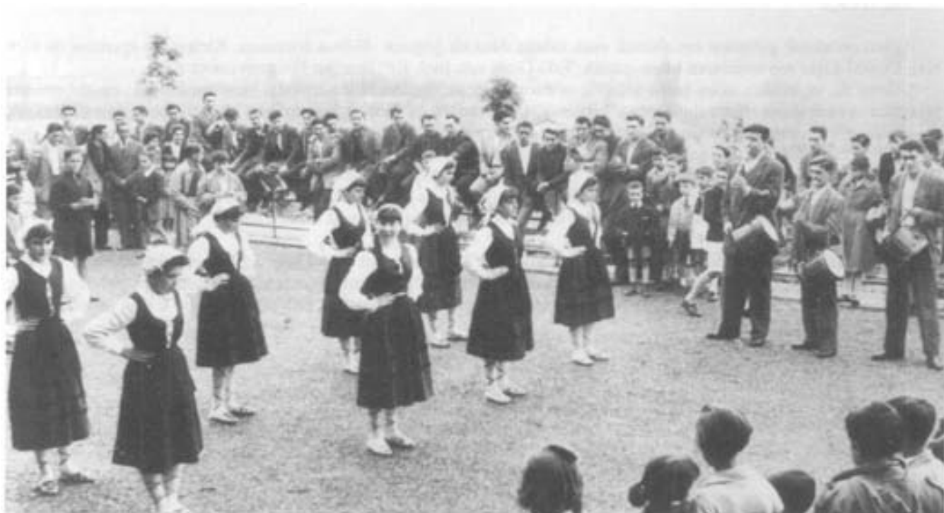
Basauri'ko neska dantzari taldea 1956'garrenko Maiatzaren 17an, Olabarrieta auzunean, Poblado Firestone orretan eleiz aurreko landan.