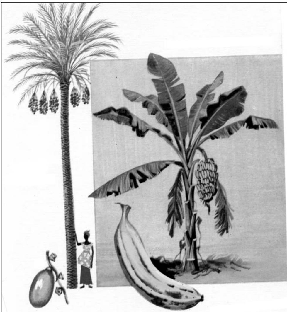
Palmondoa bere datil-frutarekin eta platanondoa frutu-mordo batekin.