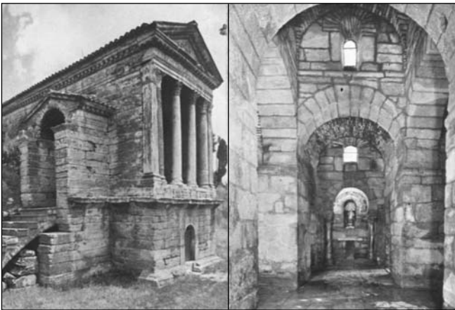
Perugia'ko eleiza bisigotikoa, Teodoriko'ren aldian.

Lan aundia basati areik federa ta kulturara sartzeko Eleizeak artu dauana, baiña arerio ikaragarri bat sortzen