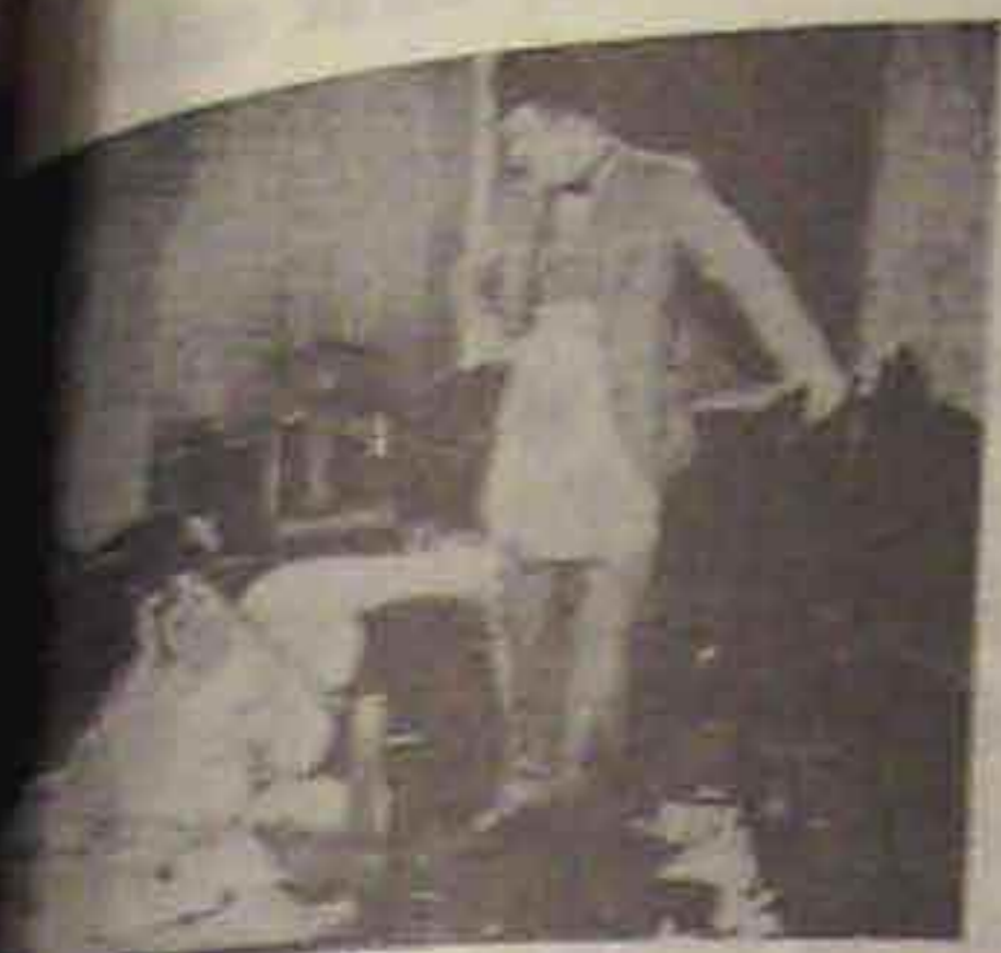
Antzezko tarta ikaragarrien garaia...

...anoa lez da entzutea, egaz ...na. Egazkadea nun asten ...ez dakizu sarri. Antzezleri ...aintza autu-mautu ta alegi ...ta asi zan, zine mutuaren ga ...lan eta zerak zuzentzen zi ...Leo Mac Carrey'n etxean ba ...e. "Cahiers du cinéma" (zi ...ingurraztiak) deritxon aldiz ...m, 1965'an, egin eutsoen ...izketa baten, onela diño: ...dot nik egungo aaztuko, an ...ari bi oneik alkarregaz aldiz ...ko erabagia artu neban egu