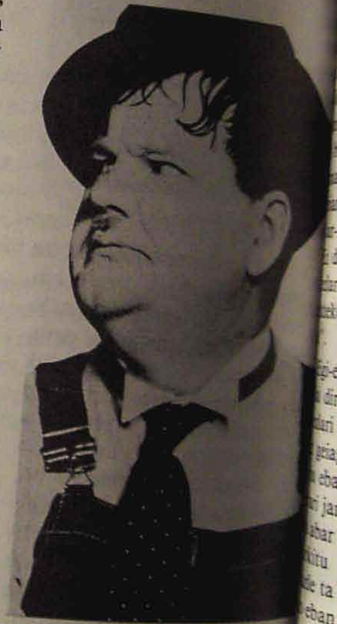
Oliver Novel Hardy

dizkari ta egunerokoak saltzen lilia; antzezleri gero, baita izan xarmanten kantari be, zine-antzezleri bat zabaldu nai izan eban. Hollywood'ra eldu orduko nunbata lana egin eta berezko mutua lilluraturik ekarri lako bereziki. Bere izate ta gaitasunak puzkerak berez daroa paper bereziki ta astunak egitera, irugarren munduko antzezleri lakoak sarri; alan eta guzti bereziki ederto darabiltz bere eun eta ogea tamar kiloak bosteun pelikula baten berrizazio geiagotan, 1913'tik 1926 bitartean. Laurel'ekin alkartu zanetik bereziki jakina.