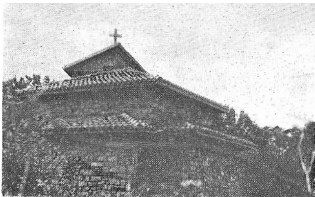
Mungia'n Billela'ko ermitea, beste ikuspegi batetik