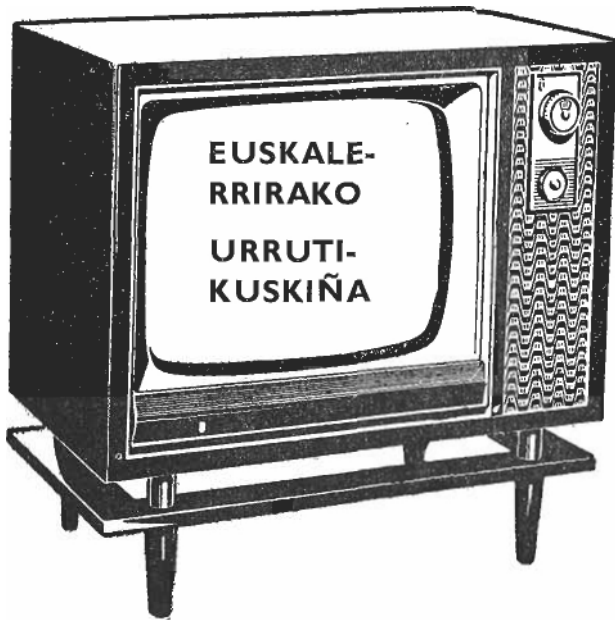
Euskaldunen tzat kultura -bidebat