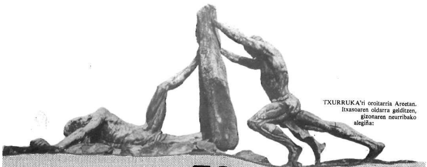
TXURRUKA'ri oroitarria Areetan. Itxasoaren oldarra gelditzen, gizonaren neurribako alegiña: