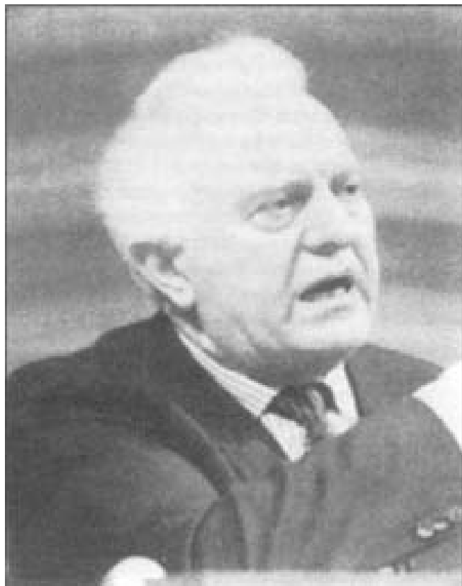
She rardoud-.e loganbuille ono irungo du latemi-urteI'o arte-e monetaruko.

Laterri Batuetatik eta Europa'tik diru laguntza gitxi artuko dabe Errusia barruan gauzak geiago zuzendu arte.