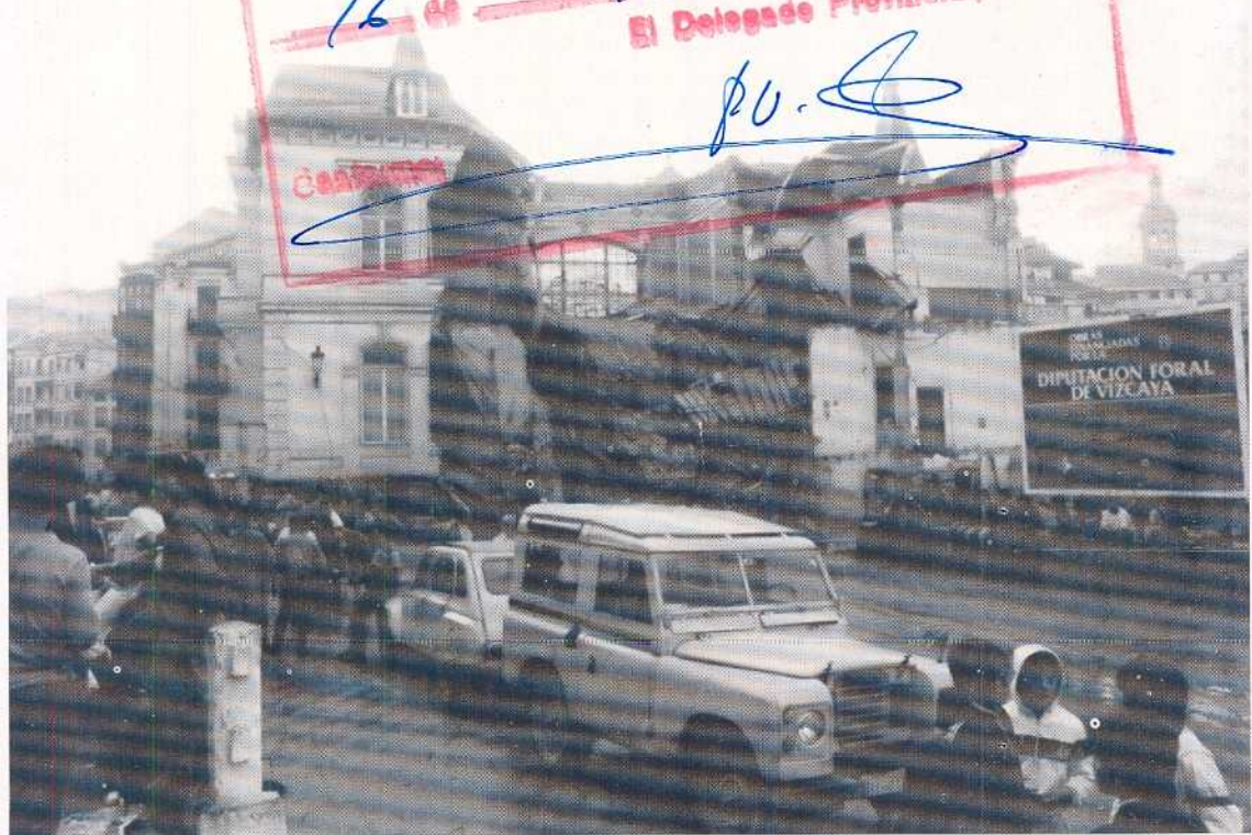
URIOLEA EUZKADI'n BERMEO'KO OTSO-ETXEA (Kasinoa) (1983-VIII-26)

DELEGADO PROVINCIAL DE Cultura Delegado a las 12 1/4 horas del día 16 de 12 de 19 83 El Delegado Provincial, pu. [Signature]