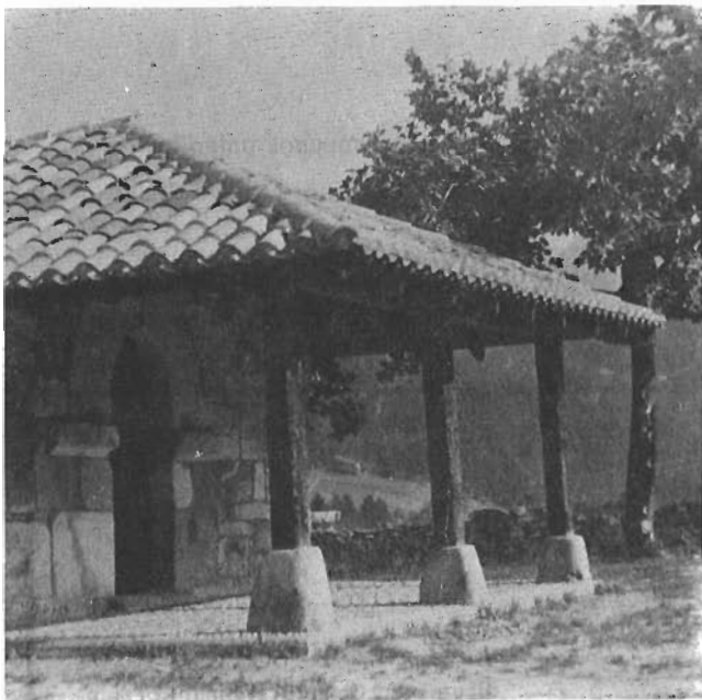
Bediaga'ko Bixente deuna (zornotza'n)

Oartu geinken lez 1612n.urtean izan ziran 16'retatik 1785n.'ean 13 geratzen dira. Sinismena galtzen joialako ete zan? Nok jakin!