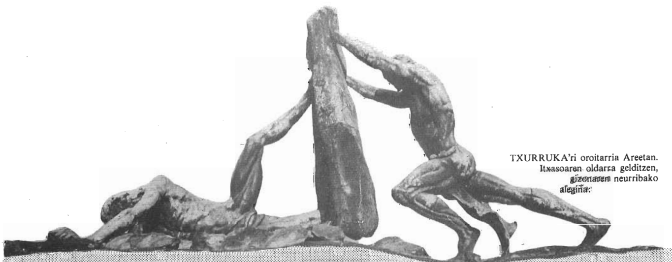
TXURRUKA'ri oroitarria Areetan. Itxasoaren oldarra gelditzen, gizonaren neurribako alegiña: